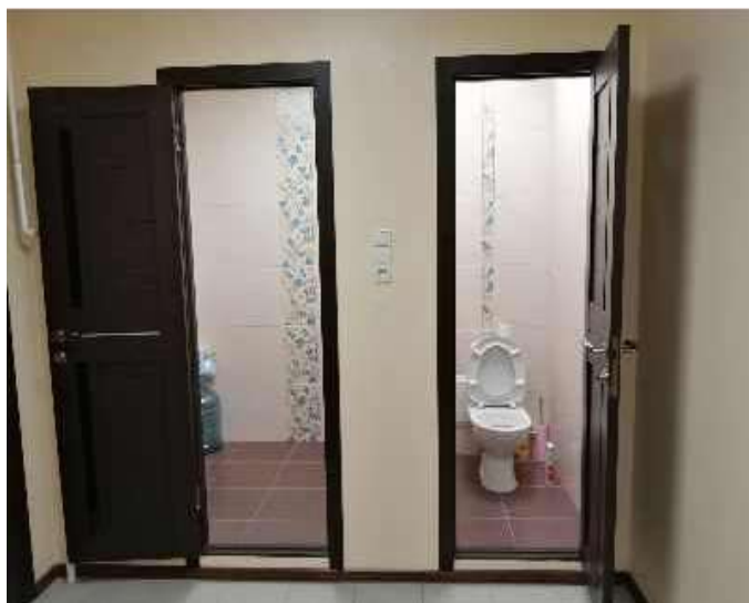
Фото: санитарные комнаты

Помещение находится в центр города Сургута, в шаговой доступности от учреждений образования, культуры. Рядом для удобства посетителей находится автобусная остановка, парковочные места и точки общественного питания.