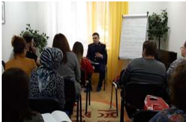
Фото: групповые формы работы очные и в режиме он-лайн

Созданы условия для консультирования по телефону и с использованием средств виртуальной коммуникации (Skype, Zoom).