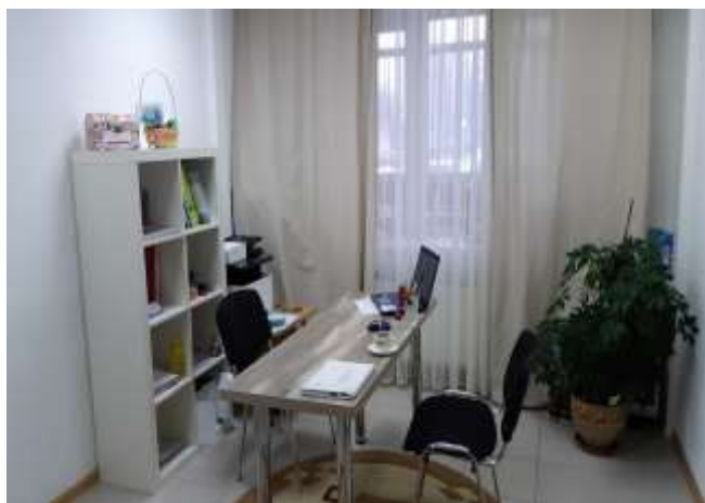
Фото: помещение для проведения индивидуальных и групповых форм работы по программам помощи семье

Также центр использует помещение по договору партнёрства (безвозмездно) по адресу: ул. Бажова, д. 29, площадь помещения 26 кв.м. (данное помещение является муниципальной собственностью администрации г. Сургут). Данное помещение используется для мероприятий социальных проектов.