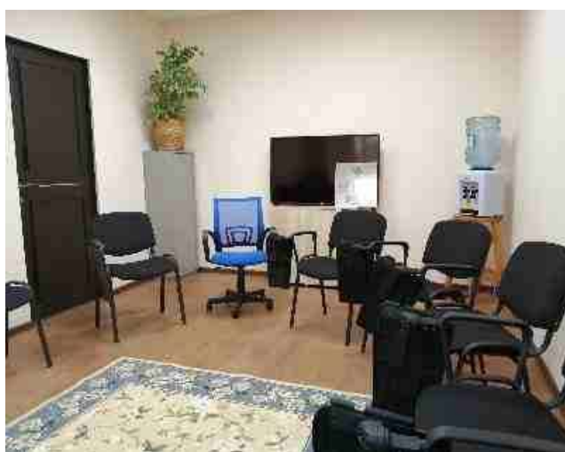
Фото: помещение для проведения групповых форм работы «Школы приемных родителей»

Мероприятия «Школы приемных родителей» проводятся в помещении ООО «Акрополь» на условиях договора аренды нежилого помещения № 41А/2020 от 31.08.2020 г. по адресу: ул. Ленинградская, д. 11, офис 206 «А», площадью 26 кв.м. Данное помещение имеет заключение о соответствии объектов защиты обязательным требованиям пожарной безопасности, а также санитарно-эпидемиологическое заключение о соответствии объектов государственным санитарно-гигиеническим правилам и нормативам.