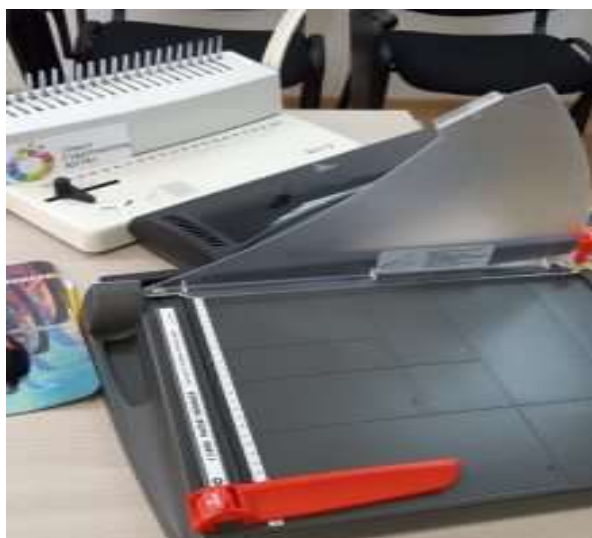
Фото: оборудование и дидактический инструментарий

Помещения оборудованы специализированным оборудованием: компьютерное оборудование, доска, телевизор, мини-типография, сейф. Для проведения психологического обследования граждан есть необходимый психологический инструментарий фирмы «Иматон» (г. Санкт-Петербург).